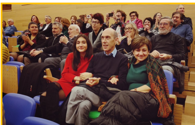
Il pubblico soddisfatto